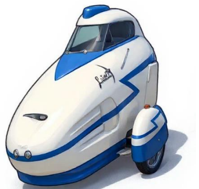
Leitra 1980, Danmark

Oljekrisen väckte nytt intresse för alternativa fordon. I Nederländerna, Tyskland och Danmark började entusiaster bygga strömlinjeformade liggcyklar med kaross – de första moderna velomobilerna. Kända märken som Leitra (Danmark) och Cab-Bike (Tyskland) etablerade sig under den här tiden.