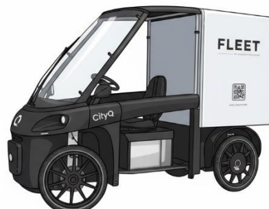
CityQ Cargo 2025, Norge