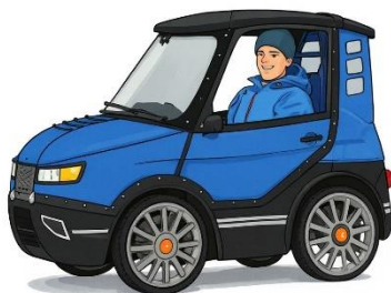
Updigity, PodRide 2016, Sverige