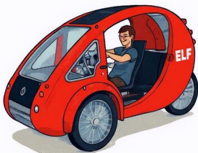
Organic transit, ELF 2015, USA

När el-cykelmotorer blev vanliga öppnades nya möjligheter. Plötsligt kunde större, bekvämare och mer praktiska cykelbilar bli användbara även i stadstrafik. Intresset växte snabbt, med projekt som ELF (USA), PodRide (Sverige) och Podbike (Norge) som fick stor internationell uppmärksamhet.