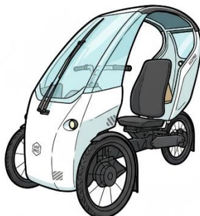
Envo, Veemo 2023, Canada