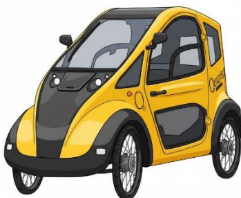
Quadvelo 2023, Belgien

Flera tillverkare i Europa och Nordamerika har börjat producera praktiska cykelbilar i små serier. Quadvelo (Belgien) och Veemo (Kanada) är exempel på modeller med el assistans och väderskydd, riktade till pendlare. Samtidigt används lastcykelbilar som CityQ (Norge) för paketleveranser i storstäder.